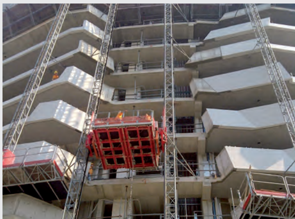
Un ponteggio autosollevante bicolonna colonna installato da E-mac nel cantiere City Life a Milano.