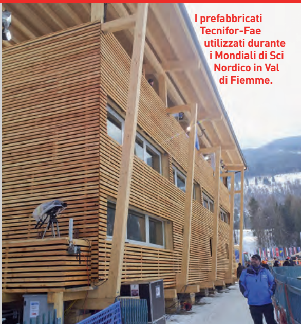
I prefabbricati Tecnifor-Fae utilizzati durante i Mondiali di Sci Nordico in Val di Fiemme.

Azienda specializzata da oltre 30 anni nel noleggio e assistenza di piattaforme aeree, macchine movimento terra, autogrù e sollevatori telescopici. Con oltre 30 punti noleggio in tutta Italia è in grado di fornire sempre la soluzione più adatta per ogni esigenza di cantiere. Nello specifico il suo parco noleggio è composto da piattaforme verticali, articolate, semoventi e autocarrate; macchine movimento terra e accessori, autogrù, sottoponti, ragni, e sollevatori telescopici ( www.gv3.it ).