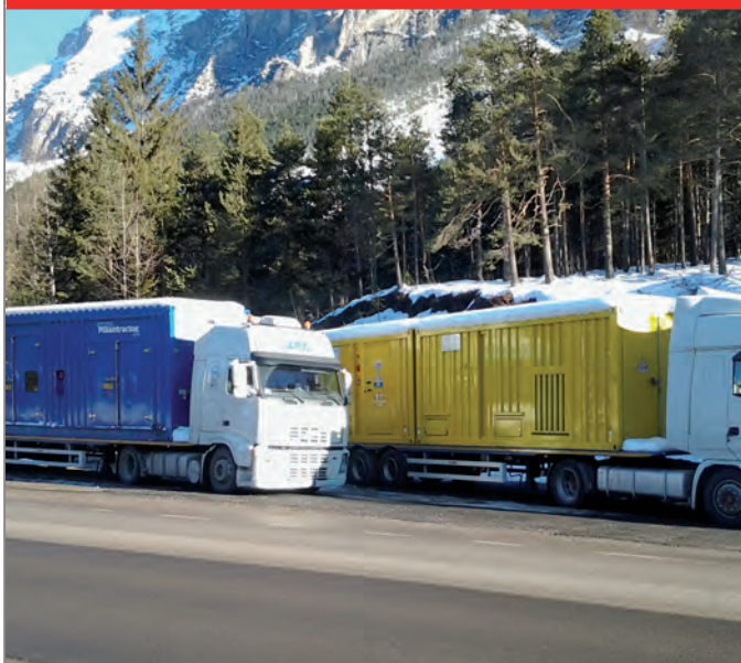
Gruppi elettrogeni e cabine di trasformazione Milantractor.

Con 45 anni di esperienza e sette filiali nel Triveneto, E-Mac rappresenta un partner ideale per risolvere le problematiche legate al mondo dell'edilizia. In particolare la società è specializzata nella fornitura a noleggio di sistemi di caseratura e di sostegno; sistemi provvisori, ponteggi di facciata e multidirezionali; ponteggi autosollevanti, montacarichi e ascensori a cremagliera; oltre a gru edili, gru automontanti, gru a torre e macchine speciali ( www.emac-it.com ).