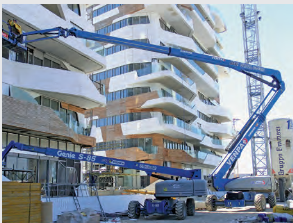
Alcune piattaforme semoventi fornite da Venpa nel cantiere milanese di City Life.